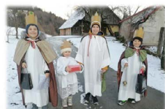
Koledniki župnije sv. Mihael Vransko

„Glejte, glejte, kaj je tam trije kralji gredo k nam.“