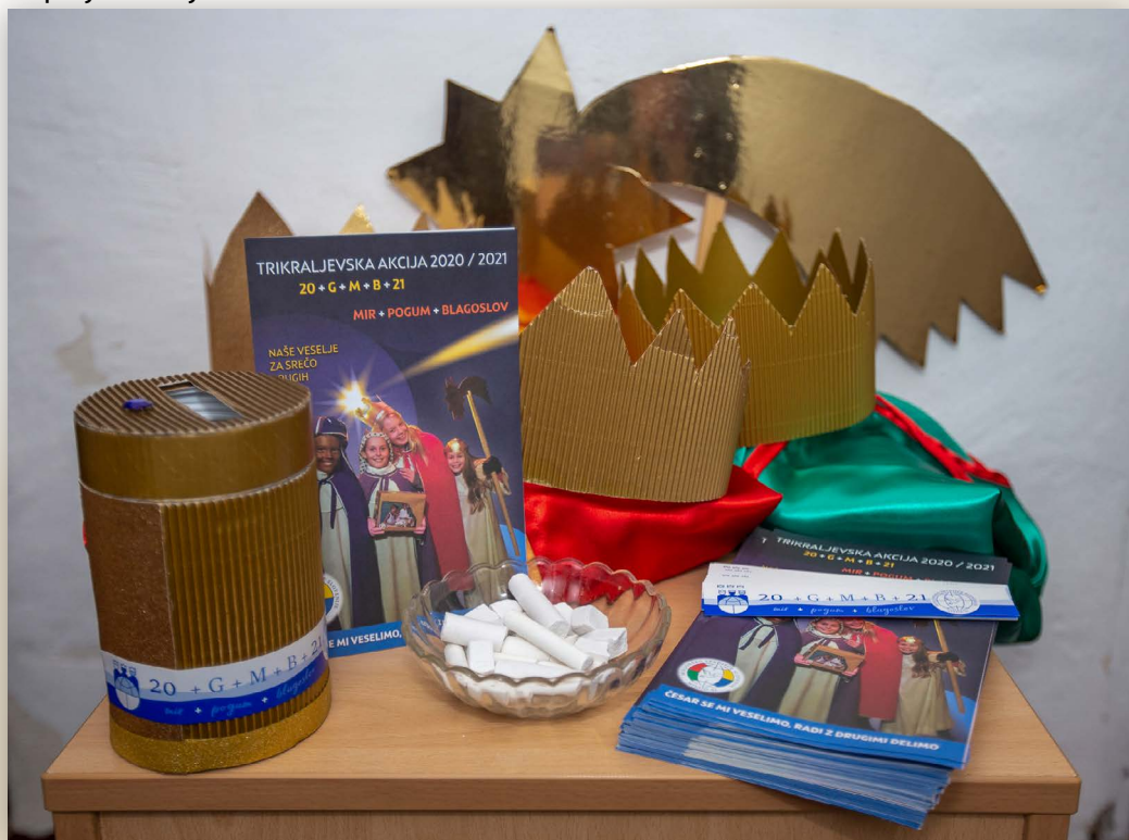
Župnija Preserje in Rakitna