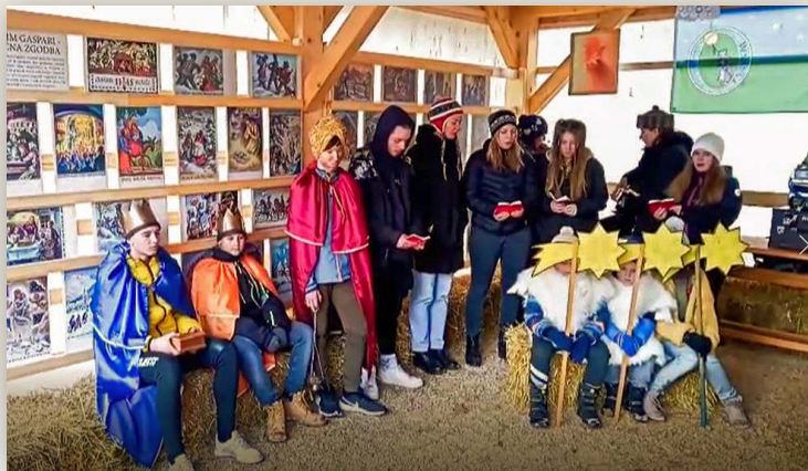
Župnija Begunje pri Cerknici