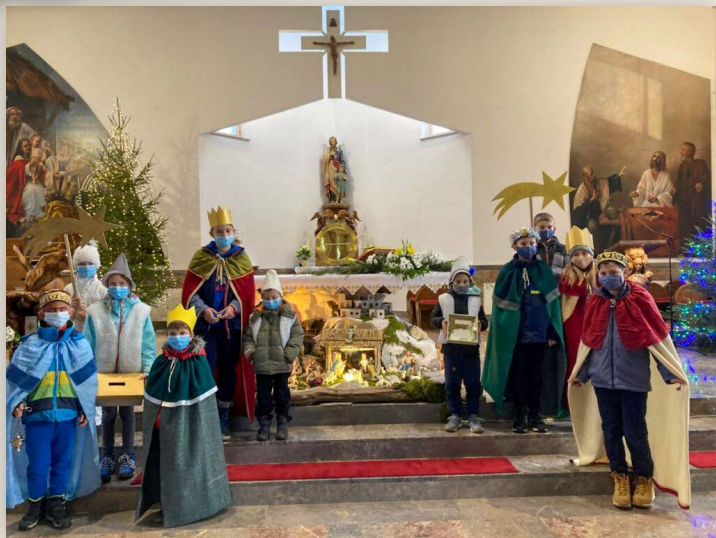
Župnija Ivančna gorica