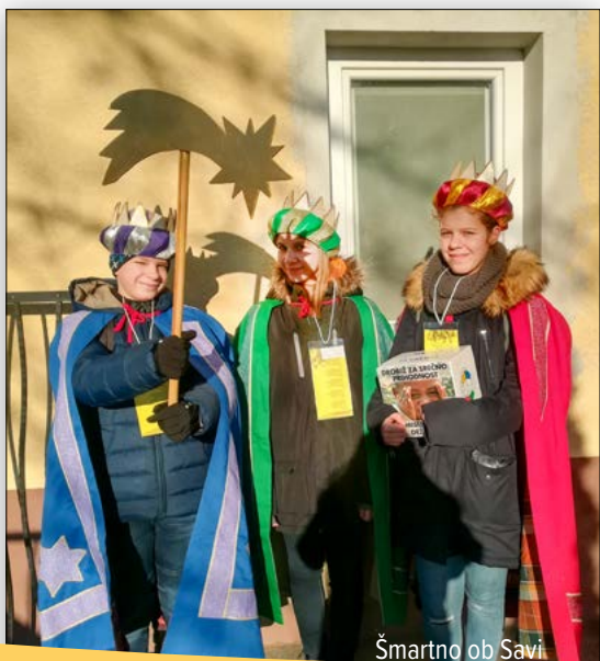
Šmartno ob Savi

Molimo. O, Bog, blago+slovi to zvezdo. Naj spremlja naše kolednike na vseh poteh k ljudem. Naj spominja na zvezdo, ki je svete tri