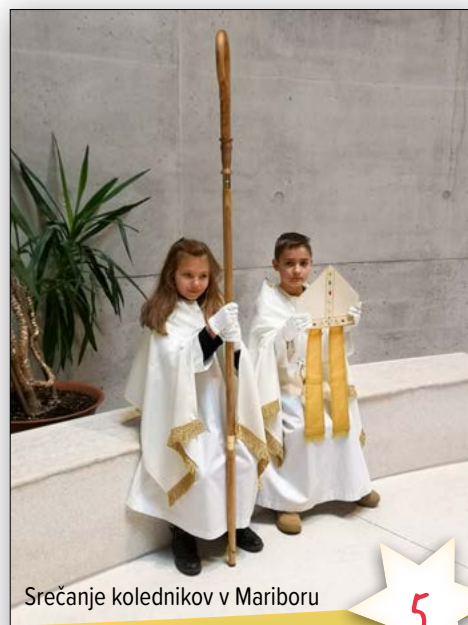
Srečanje kolednikov v Mariboru