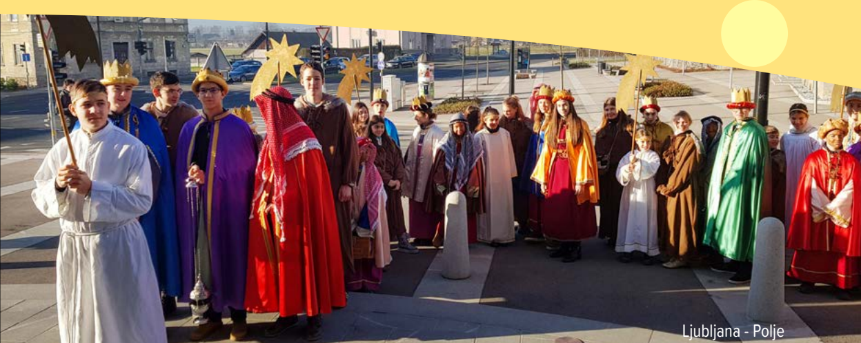
Ljubljana - Polje

kralje vodila in pripeljala k tebi. Naj vodi in varuje tudi naše kolednike. Naj vsem, h katerim jih bo pripeljala, pokaže pot k tebi, ki živiš in kraljuješ vekomaj. Amen.