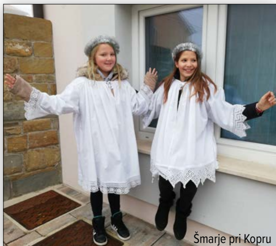
Šmarje pri Kopru

Verujem, da se po tebi med nami razodeva Očetovo kraljestvo, in da ga želiš v polnosti deliti z nami.