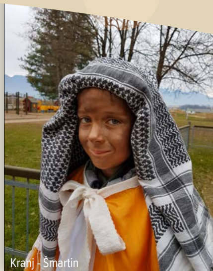
Kranj - Šmartin

Med odhajanjem pojte Tam stoji pa hlevček.