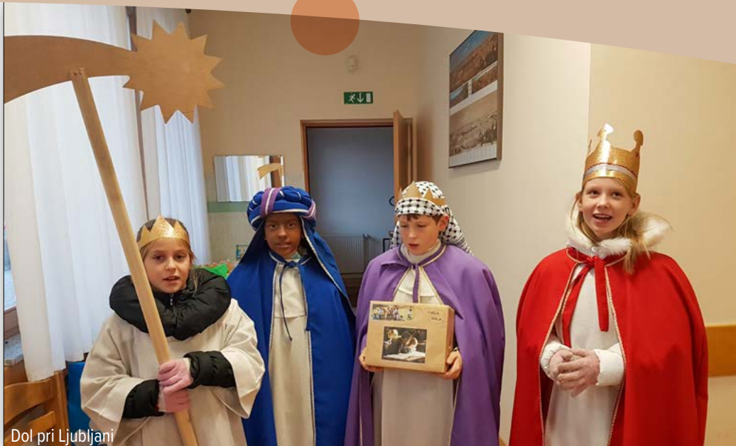
Dol pri Ljubljani