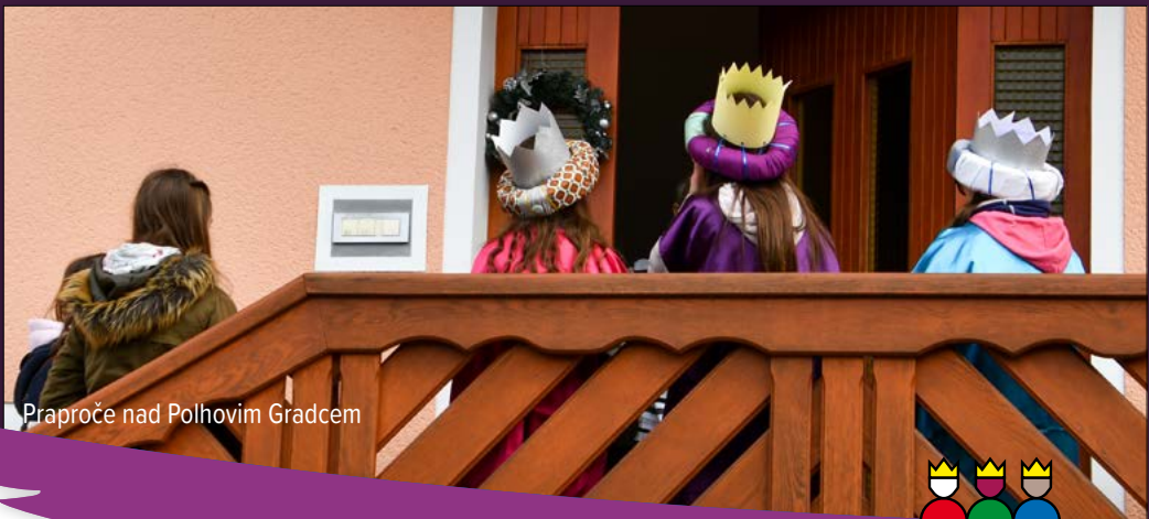
Praproče nad Polhovim Gradcem